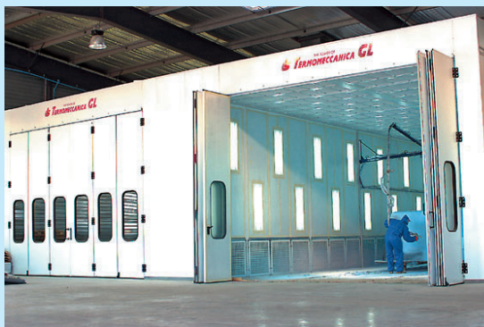
Cabine de peinture à la pointe de la technologie.