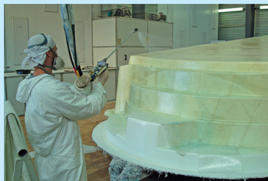
Projection 1 re couche (gel coat).