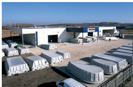
Site de production sur Istres (13) de 5000 m 2 couverts sur 2 hectares de terrain.

A côté de la gamme France Piscines Composites, nous proposons la gamme Axéo Piscines qui comporte 3 modèles à fond plat. Ces modèles sont équipés d'un bloc filtrant à cartouches et l'objectif est d'offrir un concept simple, complet et le tout à un prix très compétitif.