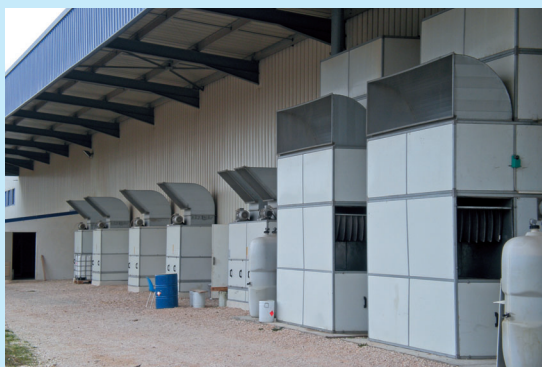
Un outil de production respectant les normes européennes d'environnement.