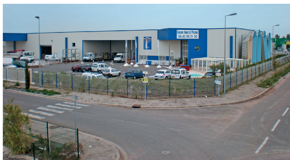
Une partie du site France Piscines Composites à Istres (13).