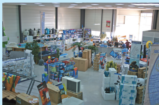
Un magasin "pilote" de vente de piscines et d'accessoires à Istres (13).