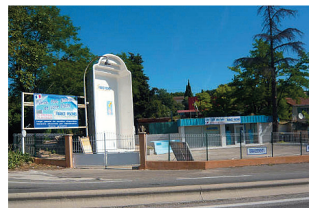
Concessionnaire France Piscines Composites proche d'Avignon.